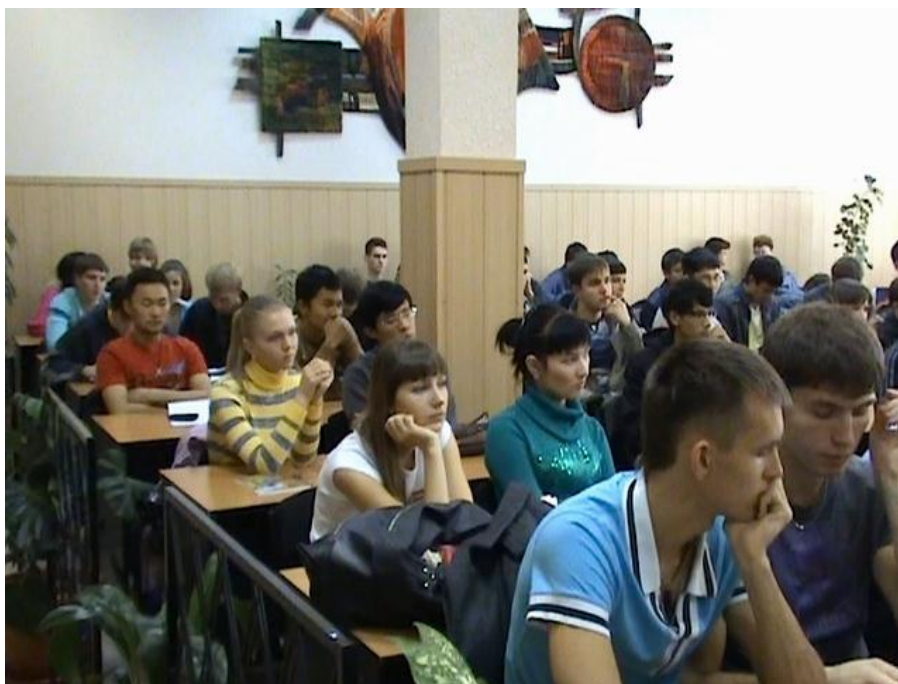
Фото 11. Посетители выставки