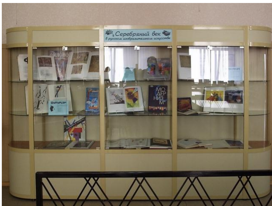
Фото 5. Экспозиция «Серебряный век в русском изобразительном искусстве»