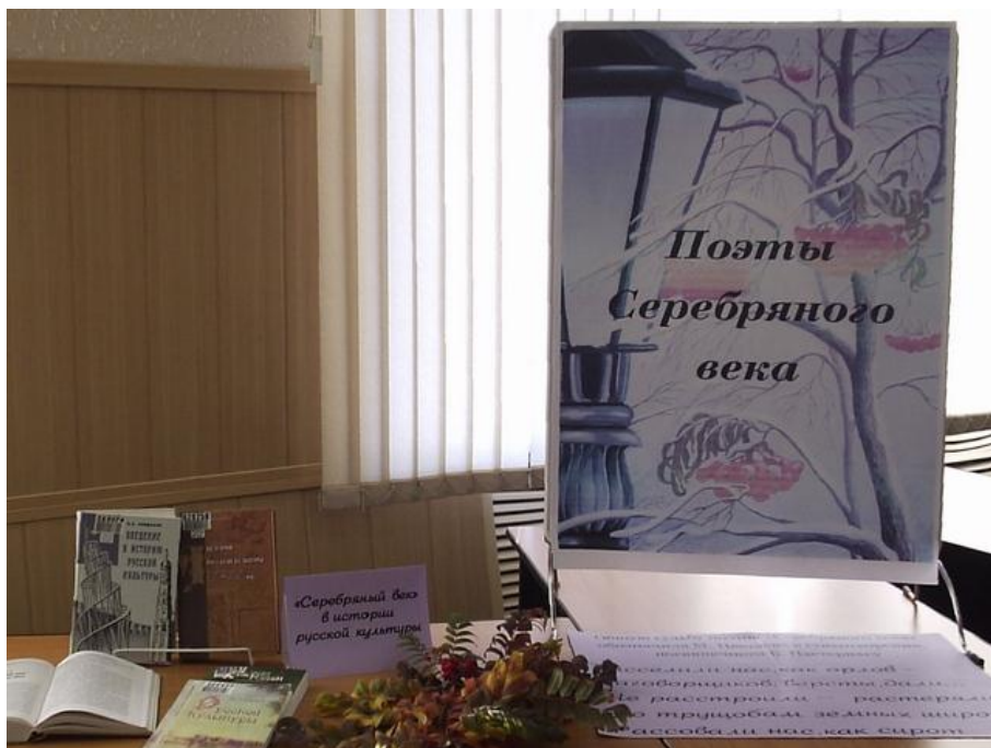
Фото 1. Заголовок выставки