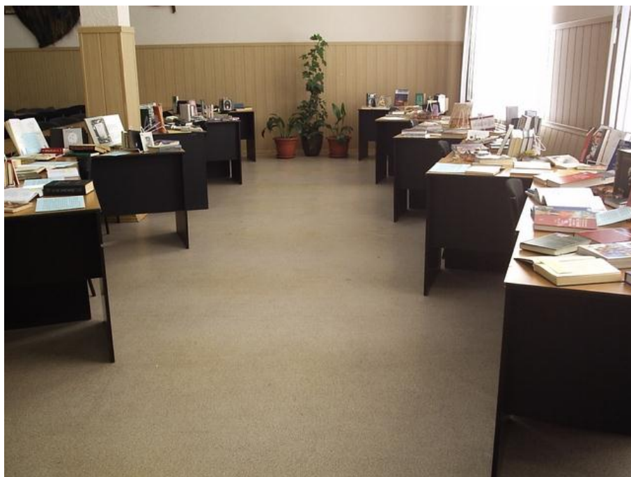
Фото 2. Общий вид выставки