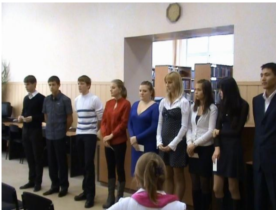
Фото 9. Выступление студентов Факультета строительства и городского хозяйства