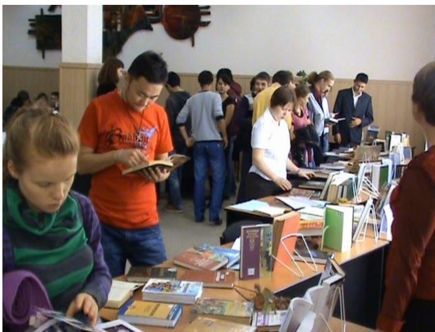
Фото 12. Посетители выставки

Выставка была открыта с 13 по 20 октября 2010 г. Всего ее посетило 228 человек, в Книге отзывов было оставлено 7 записей.