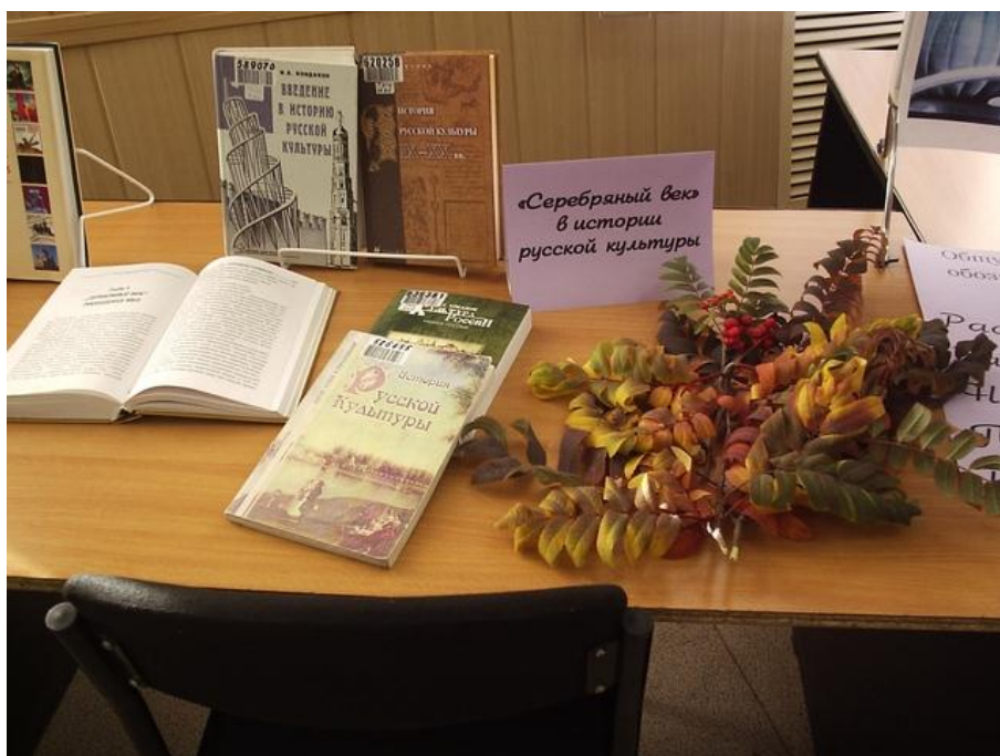
Фото 4. Книги на выставке