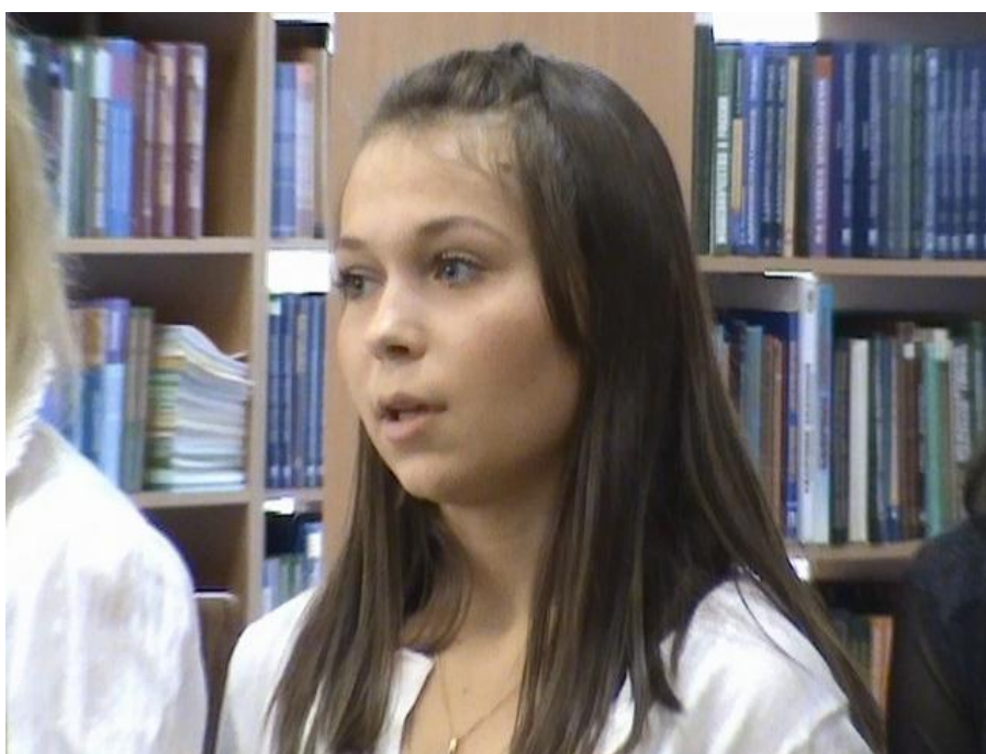
Фото 10. Выступление студентов Факультета строительства и городского хозяйства